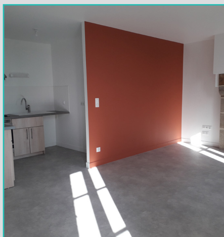
La pièce à vivre