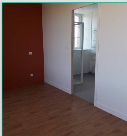
La chambre et la salle de bain