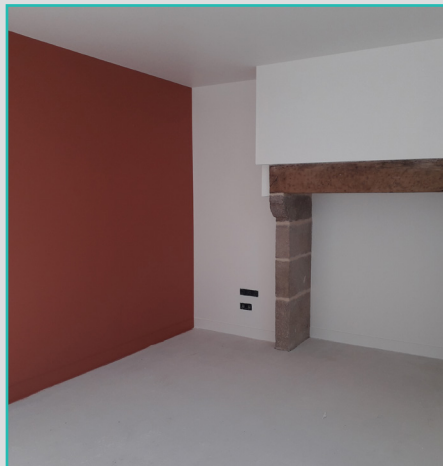
La pièce à vivre